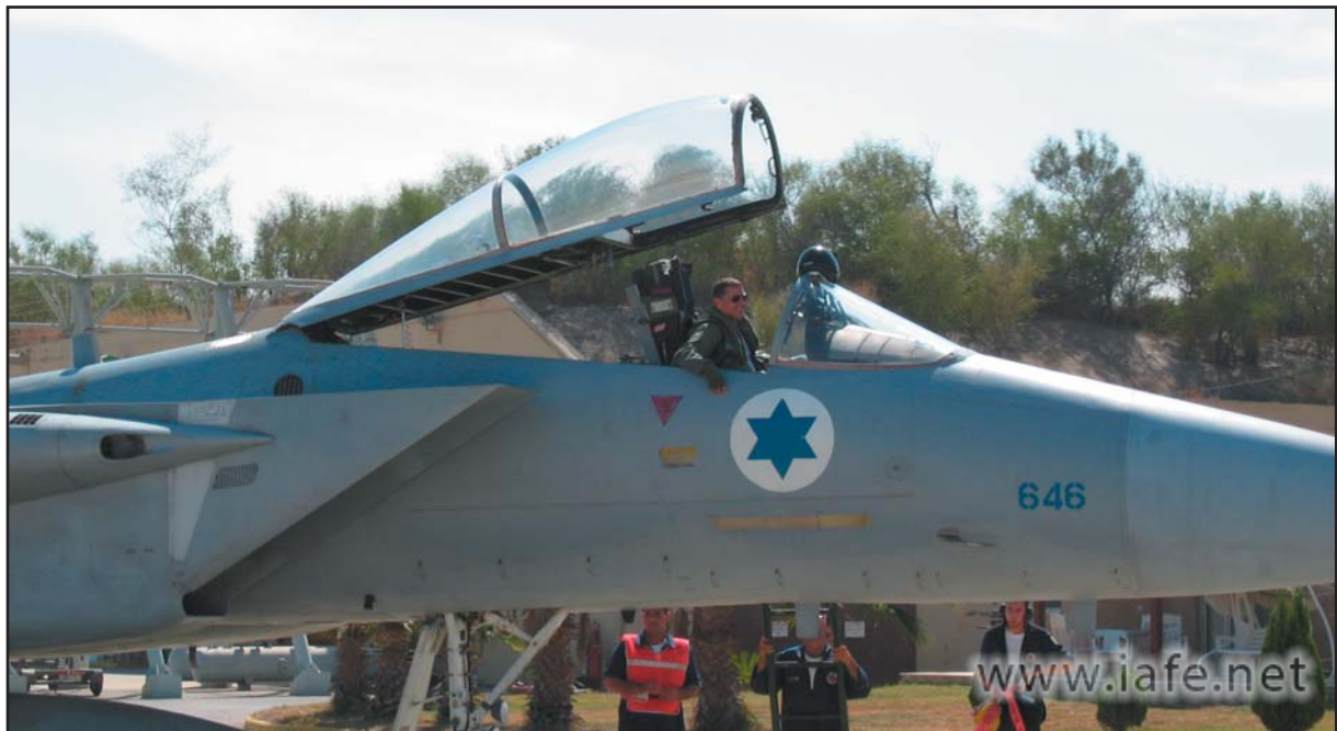
תת אלוף (מיל) משה מלניק בשובו מטיסתו האחרונה בחיל האוויר בטקס הפרידה במטוס 646.