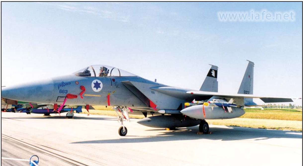
"המדליק" 663 ועליו סימן ההפלה ההיסטורית.