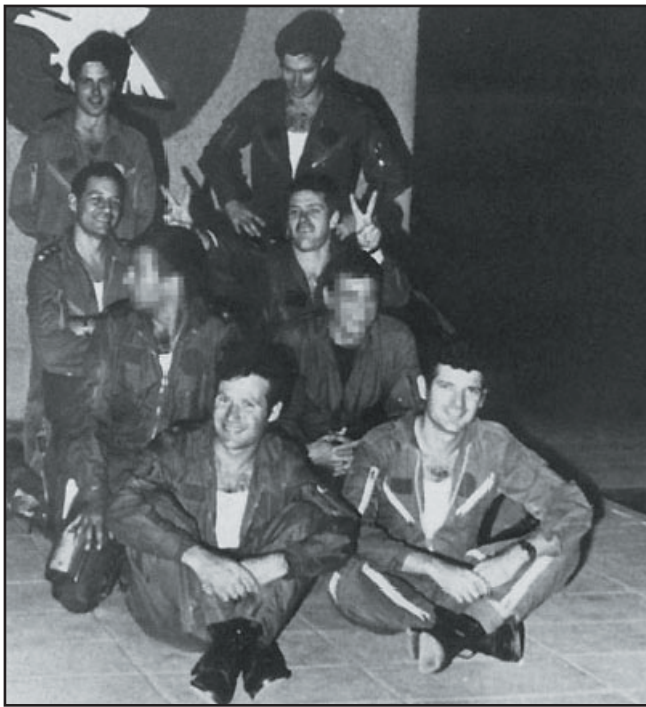
טייסי הניצים לפני התקיפה, אילן רמון עומד משמאל.