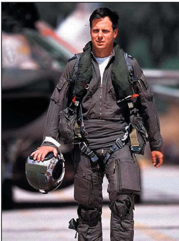
מפקד הטייסת אילן רמון בחזרה מגיחה.