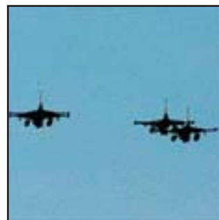
מטס הכבוד של רביעיית ה F-16.