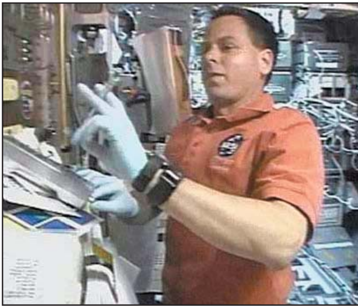
אילן רמון מבצע את אחד הניסויים בחלל.