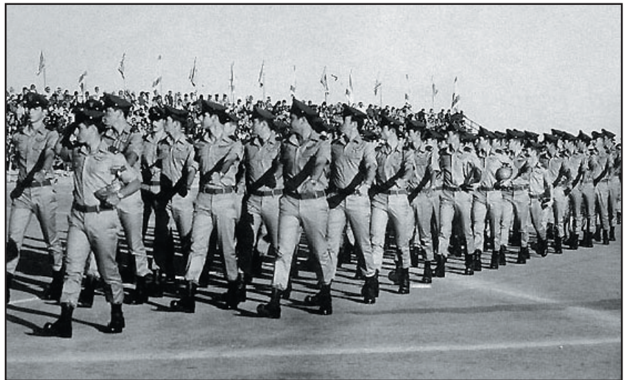
מסדר הכנפיים של קורס 75, אילן רמון החניך המצטיין מוביל את הטור מצדע.