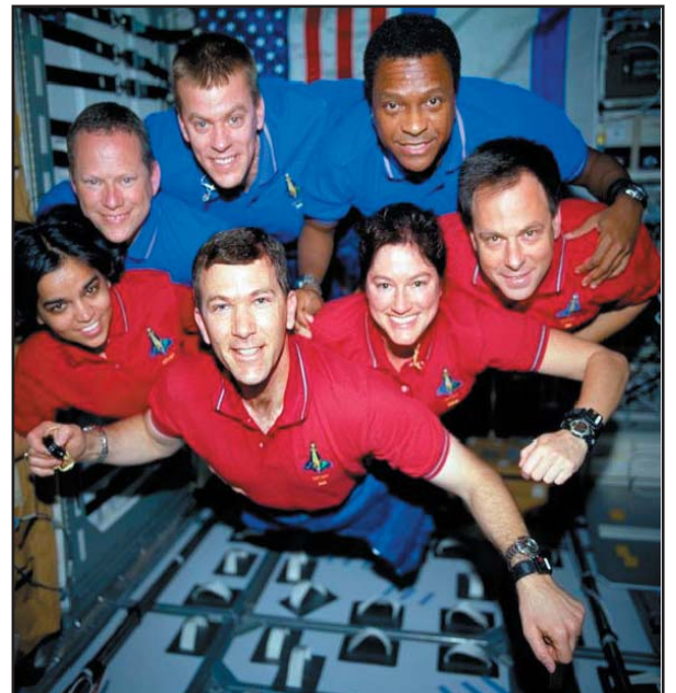
אילן רמון וחבריו מרחפים ומחייכים ביחידת המגורים שבמעבורת.