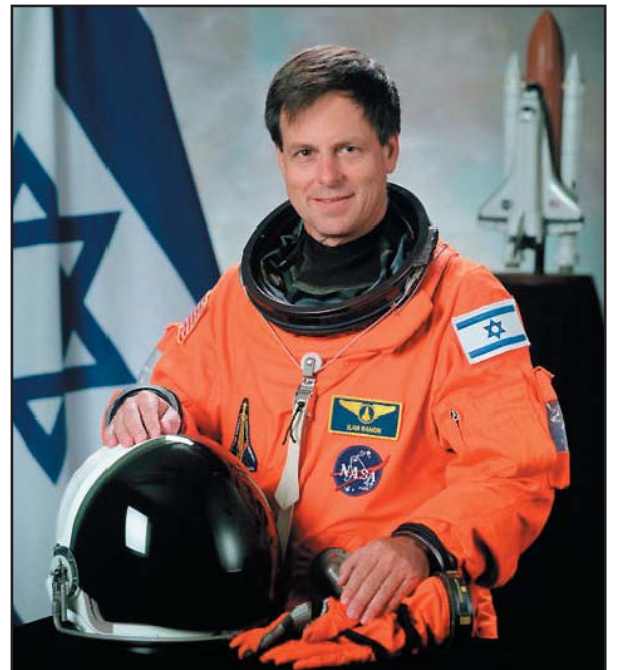
האסטרונאוט הישראלי הראשון.