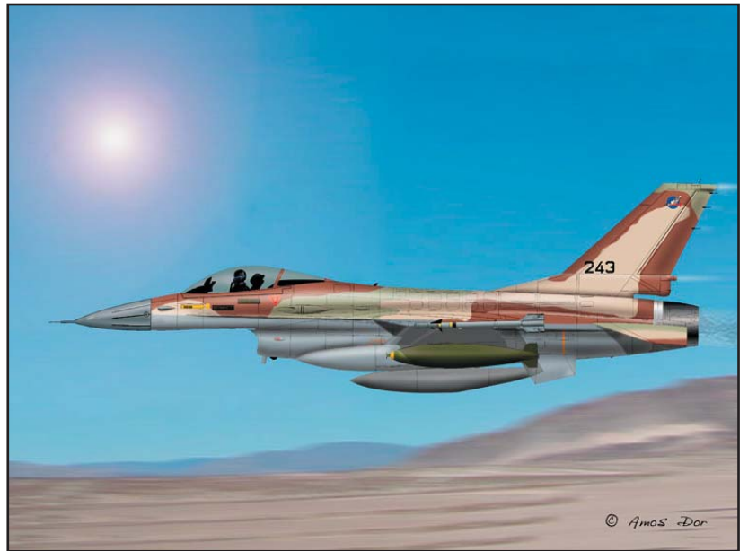
אילן רמון בנץ 243 בדרך לבגדאד, ציור מאת עמוס דור.