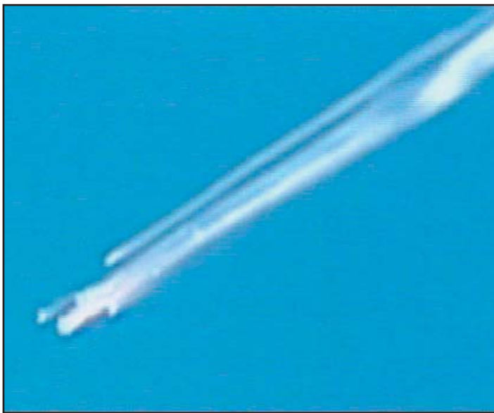
מעברת החלל המתפרקת עם כניסתה לאטמוספירה.