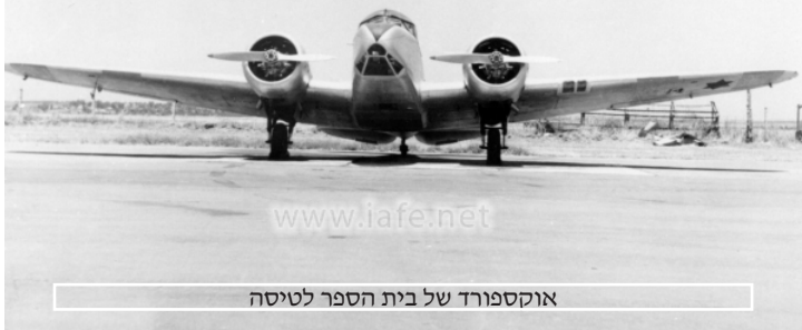
אוקספורד של בית הספר לטיסה

מטוסי הקונסול הופעלו בחיל האויר בבית הספר לטיסה ששכן בכפר ס"ר קרין ליד פתח תקווה. הם שימשו לאימון טייסים במטוסים דו-מנועיים כהכנה למטוסי תובלה, ולאימון נווטים למטוסי תובלה ולמטוסי המוס"ק יטו. כל זאת במסגרת טייסת 141. שמישות המטוסים הייתה נמוכה והיו בעיות רבות עם מנועי הציטה שלהם. חיזיון נפוץ בביה"ס באותה תקופה היה - מטוס קונסול בגישה לנחיתה עם מנוע אחד כבוי. תאונות לא מעטות נגרמו בשל תקלות טכניות והיו מטוסים שהתרסקו ונהרסו כליל, היות והיו בנויים מעץ.