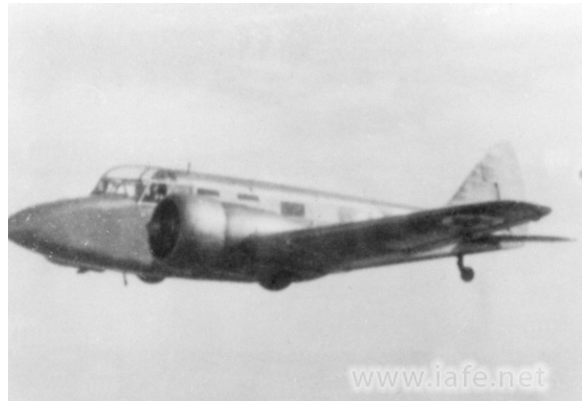
מטוסי הקונסול / אוֹקספורד ששרתו בחיל האוויר

בחיל האוויר השתמשו במטוסי הקונסול גם לטיסות מנהליות ולהספת ארמי"ם ב-11.6.1949. הוטסו ראש הממשלה דוד בן גוריון ופמלייתו במטוס קונסול של הטייסת מעקרון לסדום ומשם הוסעו דרומה. ב-12.6.1949 יצא שוב מטוס קונסול ונחת בואדי חייאני והחזיר את הפמליה לעקרון. חיל האוויר הוציא בהדרגה את הקונסולים משירות. האחרונים שבהם הוצ'או משירות באפריל 1956.