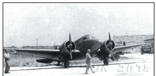
קונסול של טייסת 103 בבסיס רמת-דוד

עיקר השינויים שהוכנסו במטוס כדי להתאימו לשוק האזרחי הותקנה מח"צה כפולה עם חלונות בין תא הטייס לתא הנוסעים, והוארך החרטום שבו נבנה תא מטען עם דלת שנפתחה בעזרת צירים. כמו כן הוספו 2 חלונות מלבניים בתא הנוסעים, כשהחלון האחורי השמאלי בדלת הכניסה לתא. תא המטען העיקרי בנפח 6.09 מ"ק מוקם בין המושבים האחוריים והחציץ האחורי.