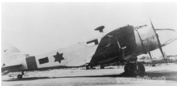
אוקספורד של בית הספר לטיסה

מטוס מס' יצרן ? - נבנה ע"י חב' איירספיד במפעלה בפורטסמות כדגם AS.10 אוקספורד 1. נמסר לח"א הבריטי במאי 1943 וקיבל את המספר הסידור־רי LX427. שירת ביחידת האימון לטיסה מתקדמת מס' 21 אח"כ בביה"ס לטיסה מס' 17, אח"כ בביה"ס לטיסה המרכזי, ולבסוף בכנף מס' 931. הוצא משירות ונ־מכר ב-5.2.1951. נרשם ע"ש חב' איירספיד כ-G-AMHE ב-29.1.1951. הוסב לדגם AS.40 ונמכר לחב' AEROCONTACTS LTD. משם לחב' BRITAVIA LTD. נמכר לח"א ב-4.7.1952 וקיבל את המספר 2815.