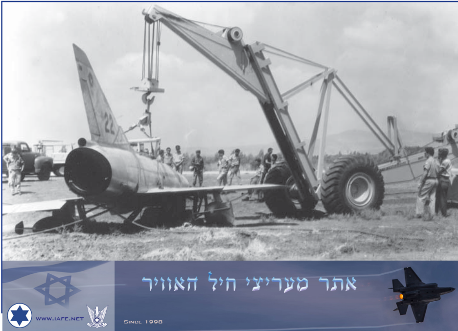
חילוץ שחק מספר 22 לאחר שגמר מסלול בטייסת הסילון הראשונה

הרביעיה הגיעה לחצרים בגבה נמוך, משכה, "הפצצה" את המסלול וחזרה ליעפי צליפה. לאחר היעף השני הם פנו צפונה בגובה נמוך ואז פנו שמאלה